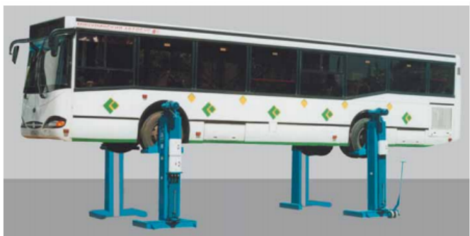
Запатентован в ФИПС